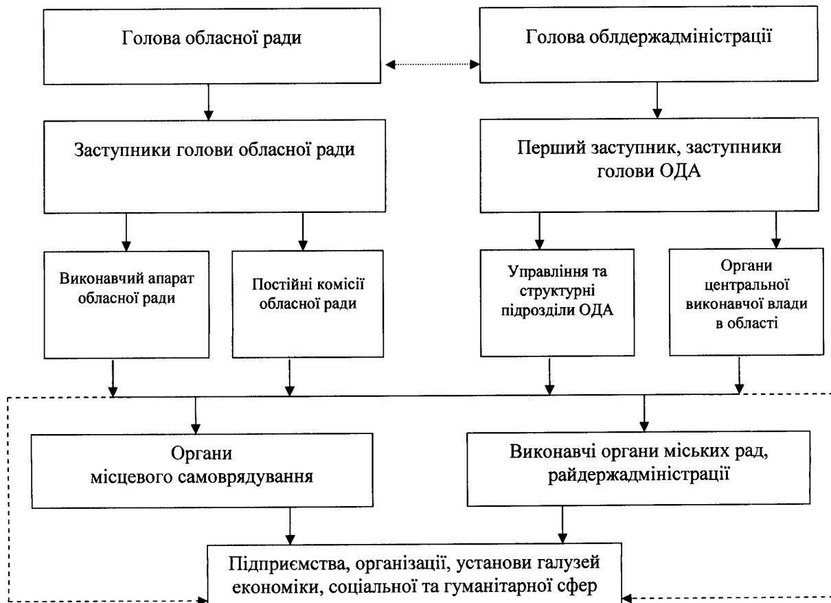
Схема організації управління ходом виконання Програми економічного і соціального розвитку Донецької області на 2012 рік

Фінансування заходів здійснюватиметься в межах видатків, передбачених в обласному бюджеті на 2012 рік.